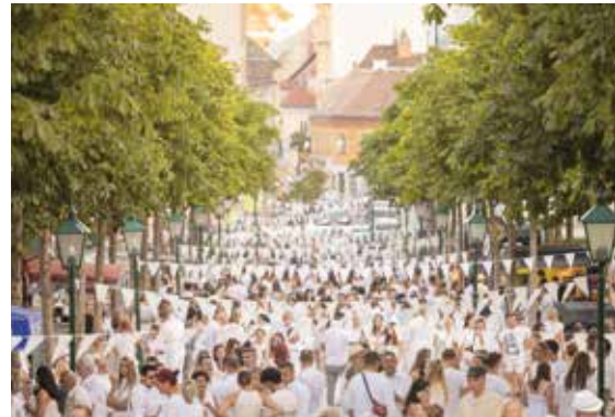
Cross Over in Perfektion: Der historische Kurpark im Partykleid