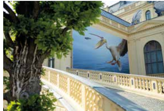
Jedes Jahr ein Hingucker: Die Großaufnahme an der Casinofassade