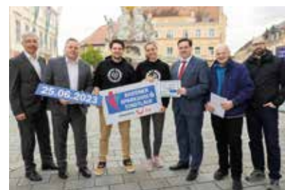
Förderung für den Badener Stadtlauf

ihr Selbstbewusstsein vor Publikum zu zeigen.