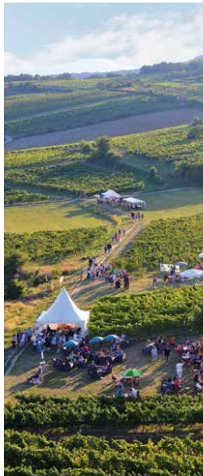
Die Genussmeile lädt auch heuer wieder zum geselligen Flanieren ein

Infos: www.thermenregion-wienwald.at/genussmeile