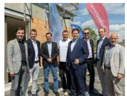
Bauherrn und -ausführende mit Bgm. Stefan Szirucsek

Acht der 44 Wohnungen sind noch zu haben. Bürgermeister Stefan Szirucsek gratulierte im Rahmen der Gleichenfeier zum zügigen Baufortschritt des Wohnbauprojekts. ■