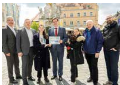
Unterstützung für die BeyondBühne

Im Juni kamen alle Tanz- und Schauspielgruppen der BeyondBühne zusammen, um ihre erarbeitete Kunst zu präsentieren. Ca. 150 Kinder und Jugendliche im Alter von 3-25 standen in der Halle B auf der Bühne, um ihre Eigeninitiative, ihren Mut und