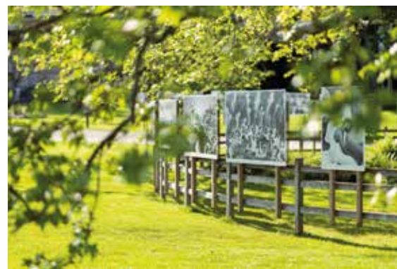
Natur und Bilderwelten im Einklang