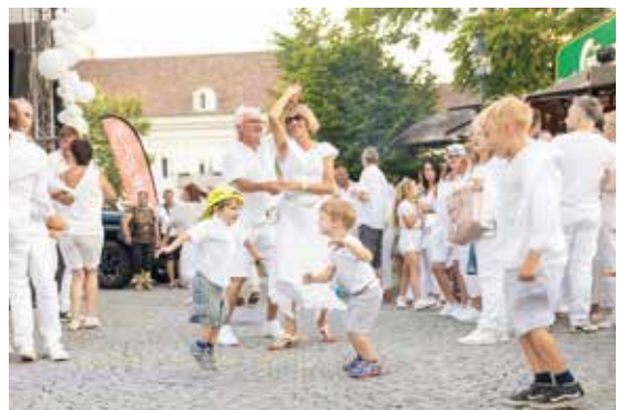
Partyfeeling für alle Generationen