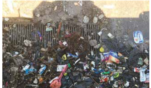
Achten wir gemeinsam auf unsere Gewässer

Die Umweltgemeinderätin bittet um Mithilfe, dieses Wissen