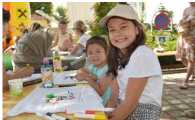
Sommerzeit ist Ferienspielzeit

Nähere Details sind wie immer der Ferienspielbroschüre zu entnehmen, die im Juni an allen Badener Pflichtschulen und Kindergärten verteilt wurde. Darüber hinaus können sie auch im Badener Bürgerservice im Rathaus sowie in der Sporthalle Baden, Waltersdorfer Straße 40, Tel. 02252 86800-822, Fax: 02252 86800-815, E-Mail: sporthalle@baden.gv.at bezogen werden.