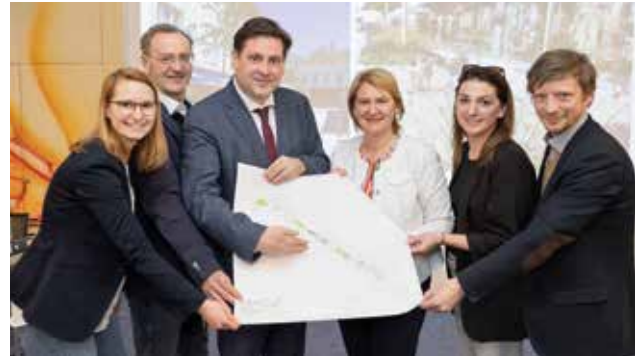
In einem konstruktiven Prozess gemeinsam entwickelt

Bereits im Sommer 2023 erhält die Wassergasse vom Hauptplatz bis zur Breyerstraße ein neues Outfit: Neben Sanierungsarbeiten wird dieser Bereich mit attraktivem Granitpflaster ausgestattet. Vier neue Bäume werden im Herzen der Stadt für angenehmen Schatten und eine Verbesserung des Mikroklimas sorgen, neue Sitzgelegenheiten laden zum Pausieren ein • Der Planungsbeginn für die Neugestaltung der unteren Wassergasse ist für Spätherbst 2023 vorgesehen. Auch in diesem Straßenabschnitt ist ein neuer Belag vorgesehen. Zusätzlich sollen neue Sitzmöglichkeiten geschaffen,