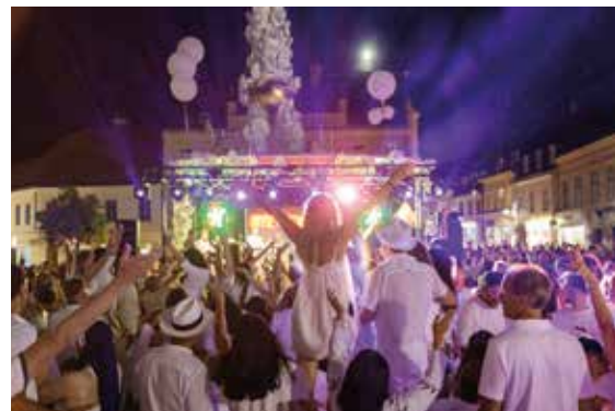
Die Band Stereoparty bringt den Hauptplatz am Samstag wieder zum Brodeln