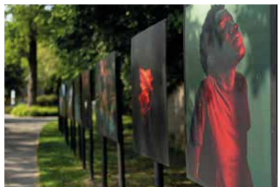
Es gibt viel zu entdecken!