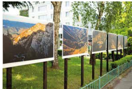
Fotokunst säumt die Straßen und Wege der Stadt